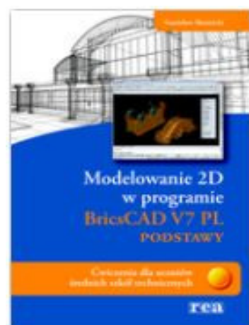
Zestaw ćwiczeń: dokumentacja płaska 2D, AutoCAD, BricsCAD

link do księgarni: http://www.rea-sj.pl/index.php?id=40&idkat=154